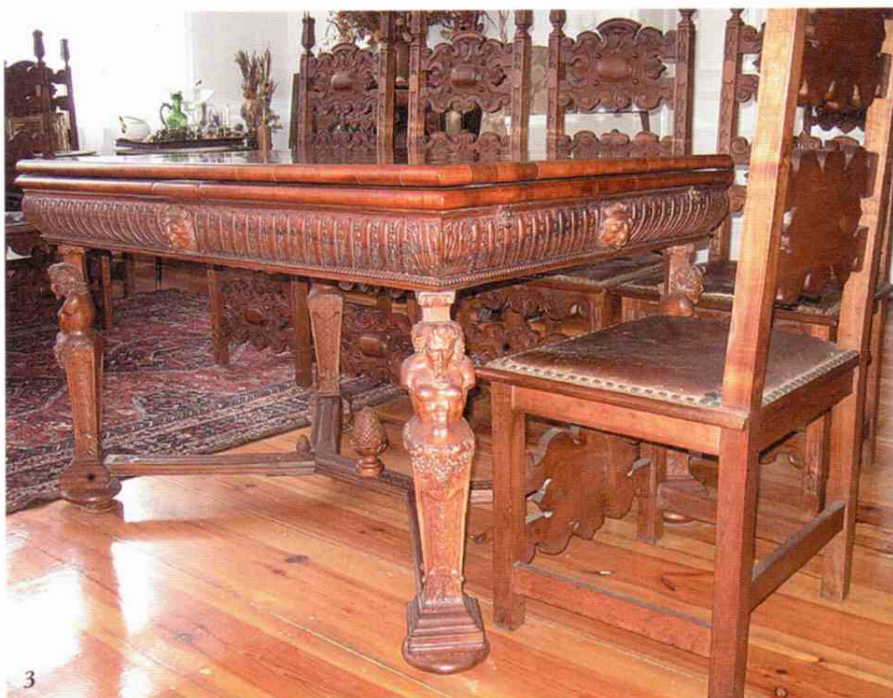
3. Стол и стулья в «стиле Ренессанс». Санкт-Петербург. 1890-е гг. Дуб, орех, кожа; резьба, интарсия. Частное собрание.